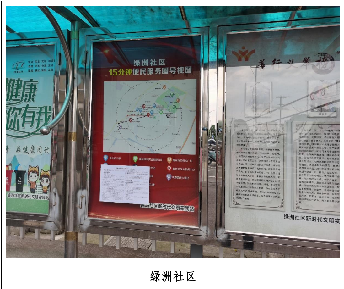
图 3.2-4 本项目第二次公示（张贴公告公示）

本项目公示张贴区域主要为项目评价范围内敏感目标处的公告栏，属于公众易于知悉的场所，符合《环境影响评价公众参与办法》的要求。